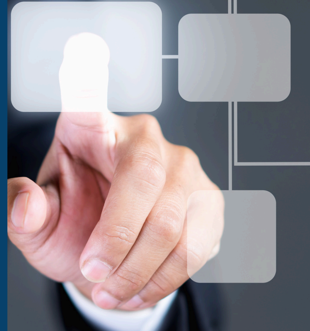
Diagrama de flujo de trabajo

Ayudamos a nuestros clientes que dentro de la organización promuevan una mejor comprensión de los procesos e identificar áreas de mejora, lo que permite al equipo comprender un proceso y sus componentes con mayor claridad.